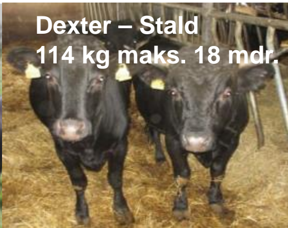
Dexter – Stald 114 kg maks. 18 mdr.