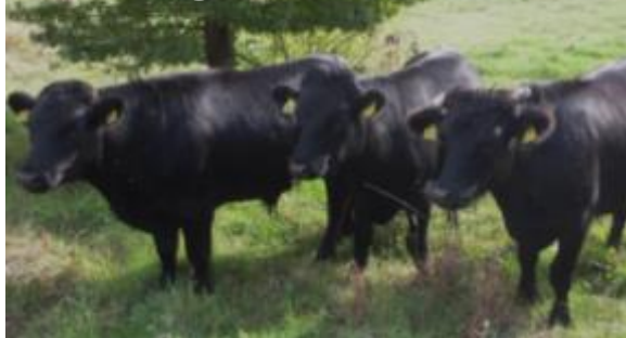
Dexter – Eng 130 kg maks. 18 mdr.