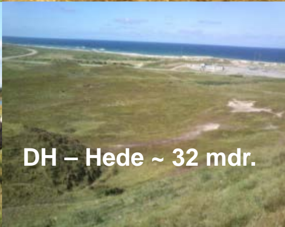
DH – Hede ~ 32 mdr.