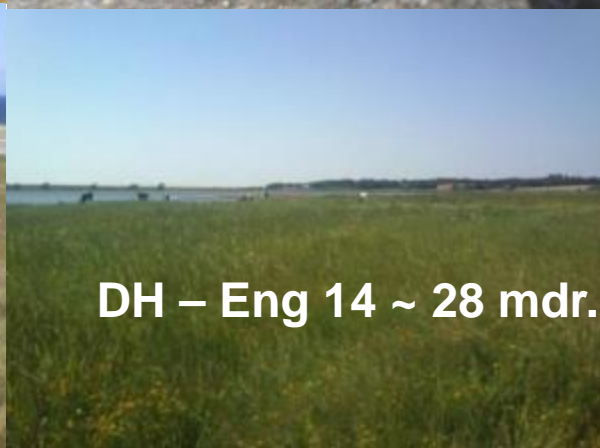
DH – Eng 14 ~ 28 mdr.