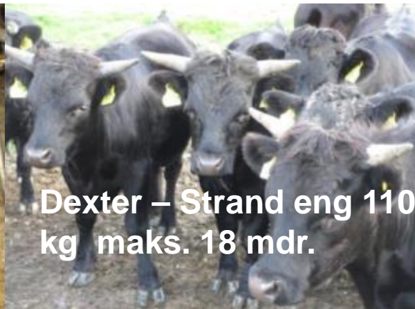
Dexter – Strand eng 110 kg maks. 18 mdr.