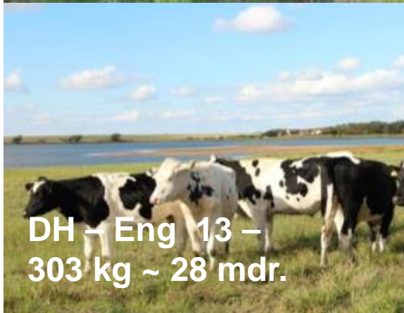
DH – Eng 13 – 303 kg ~ 28 mdr.