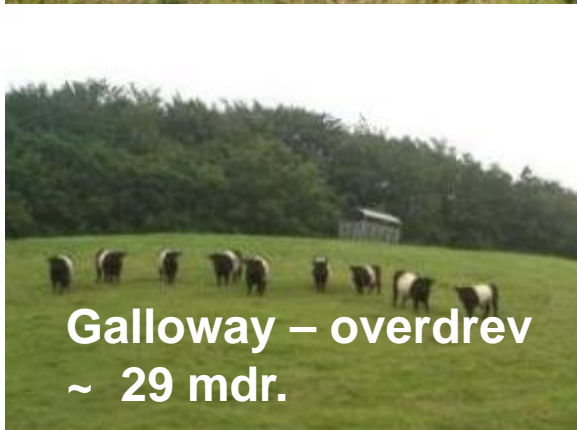
Galloway – overdrev ~ 29 mdr.